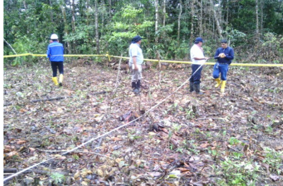
Figura 1. Levantamiento de información de los impactos generados