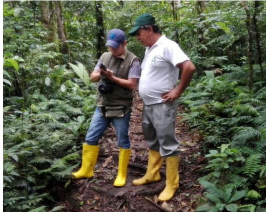
Figura 2 Georreferenciación del área afectada